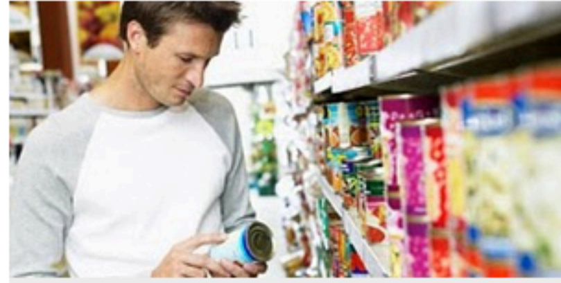
Higiene pessoal: pesquisa mostra que o número de lançamentos para homens corresponde a 37% (Reprodução)

Já se foi o tempo em que os homens passavam longe das gôndolas dos supermercados. Se, antes disso, eram suas mulheres que faziam as listas de compras da família, e ficavam horas percorrendo aqueles corredores, hoje esse marido tem um poder de decisão muito maior para controlar o que entra e o que não entra no carrinho.